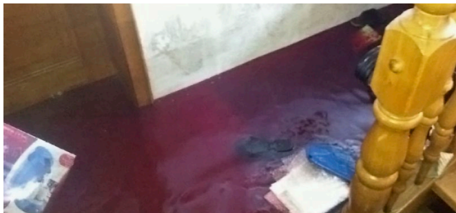
Ein Heizölschaden 2013 in Deggendorf

Ein Betroffener berichtet: „Wir wollten die Tanks gegen das Hochwasser sichern, aber es hat nichts genützt: sie sind einfach umgekippt und ausgelaufen. Überall hat es nach Heizöl gestunken, es stand sogar im Erdgeschoss noch einen halben Meter hoch. Wir haben tagelang Putz, Estrich und Mauerwerk abgeschlagen, aber vergeblich – die Ölverseuchung ging zu tief. Jetzt warten wir auf die Bagger, es bleibt nur noch der Abriss.“